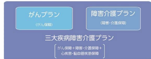
【保障範囲のイメージ】